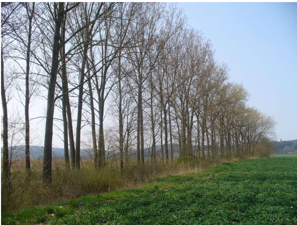
Obr. 42 Větrolam za Kostelní ulicí v obci Chornice