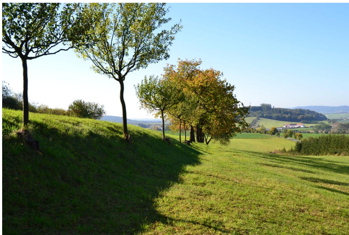
Obr. 31 Dobře udržované lemy teras pod Horkou (, 8. 10. 2012)