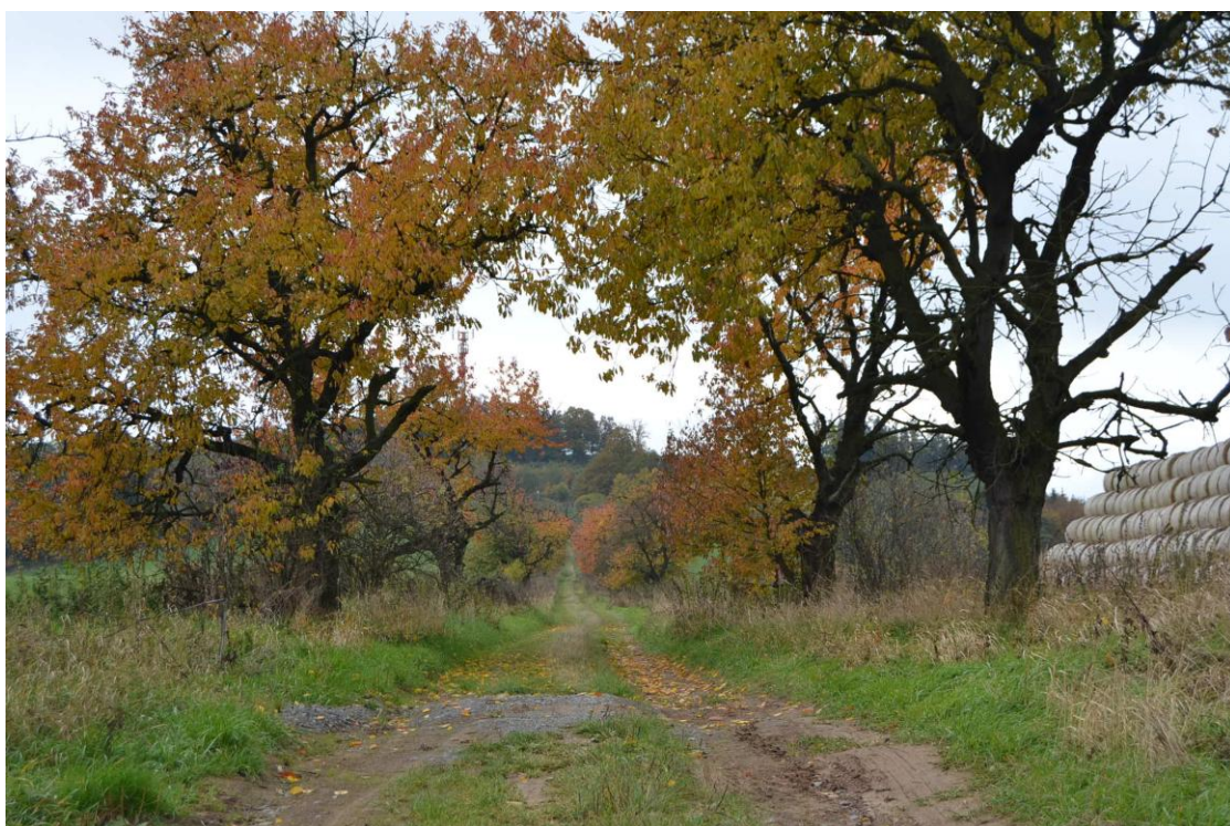
Obr. 7 Třešňová alej, vedoucí směrem na Hejk (434 m n. m.)