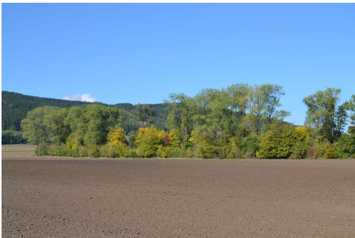
Obr. 43 Větrolam za zemědělským družstvem v obci Chornice