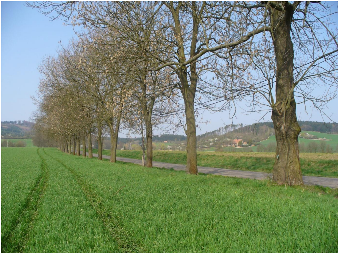
Obr. 33 Stromořadí jasanu ztepilého vedoucí od Jevíčka k sanatoriu (, 4. 4. 2014)