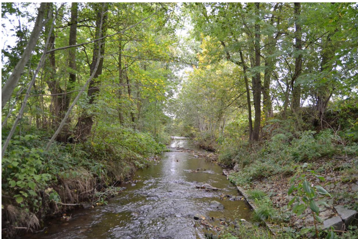
Obr. 20 Břehová vegetace kolem koryta Úsobrnského potoka