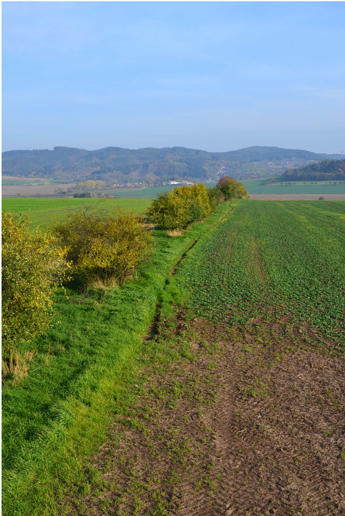
Obr. 38 Pás vegetace, členící krajinu