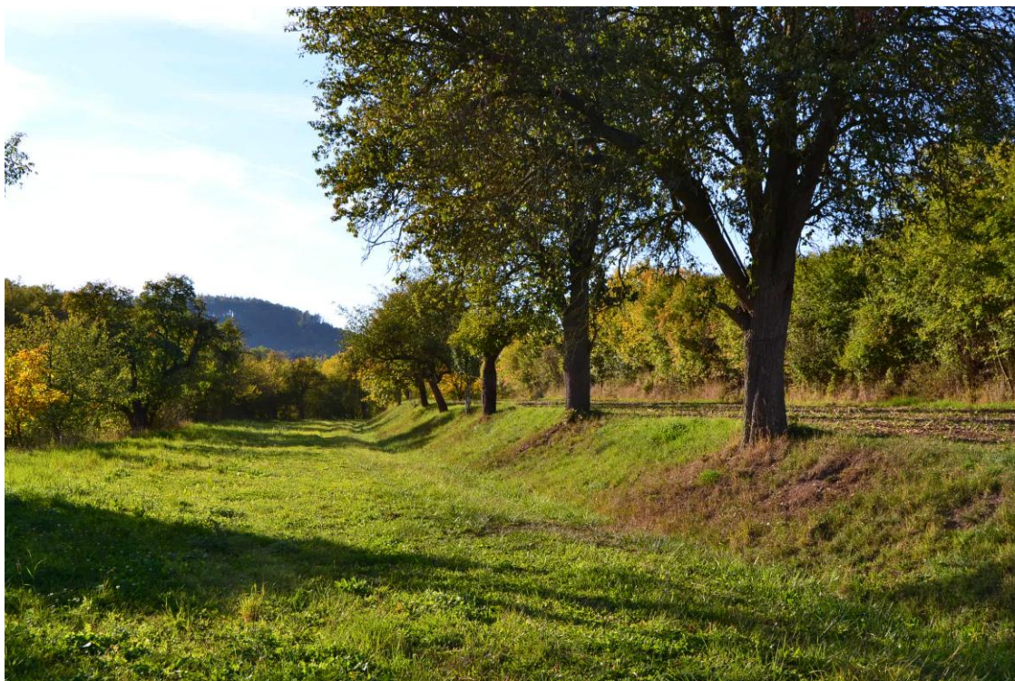
Obr. 29 Lemy teras u kostelíka sv. Bartoloměje SZ od města Jevíčka