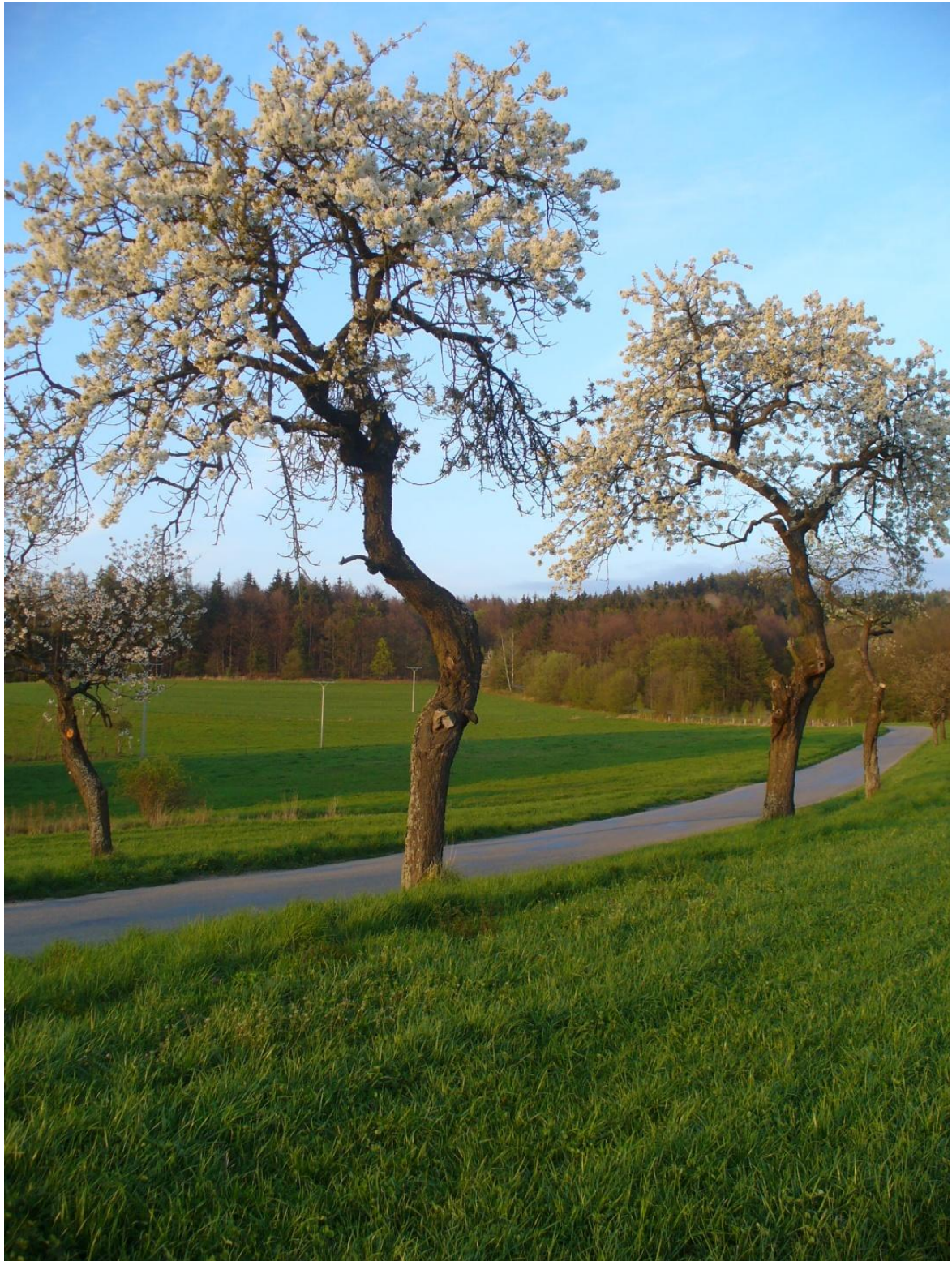
Obr. 17 Kvetoucí „torza“ třešňové aleje za obcí Březinky