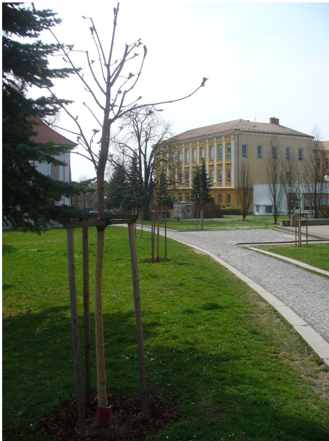
Obr. 12 Juvenilní jírovcová alej v Jevíčku, lemující ulici U Zámečku (, 4. 4. 2014)