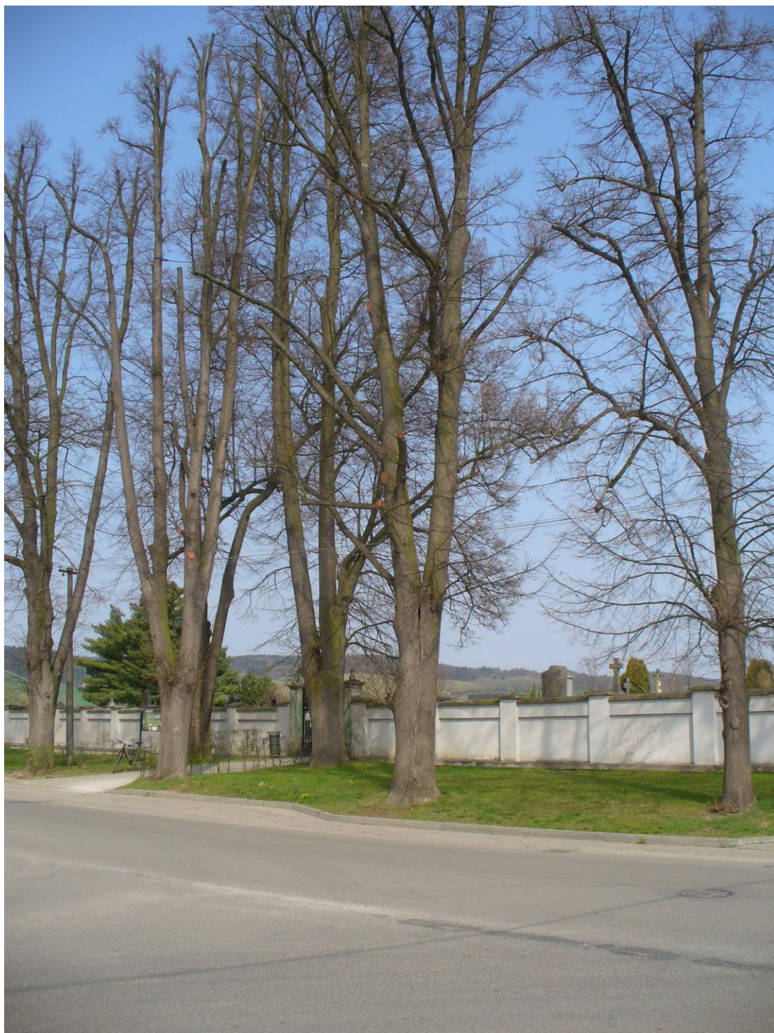
Obr. 32 Izolační zeleň – lípy srdčité před hřbitovem v Jevíčku