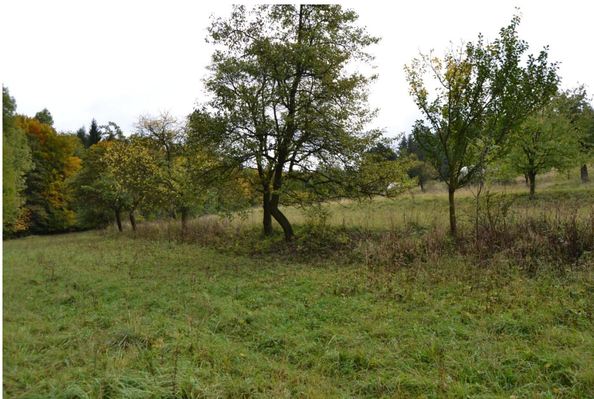
Obr. 25 Lemy teras u Zálesí