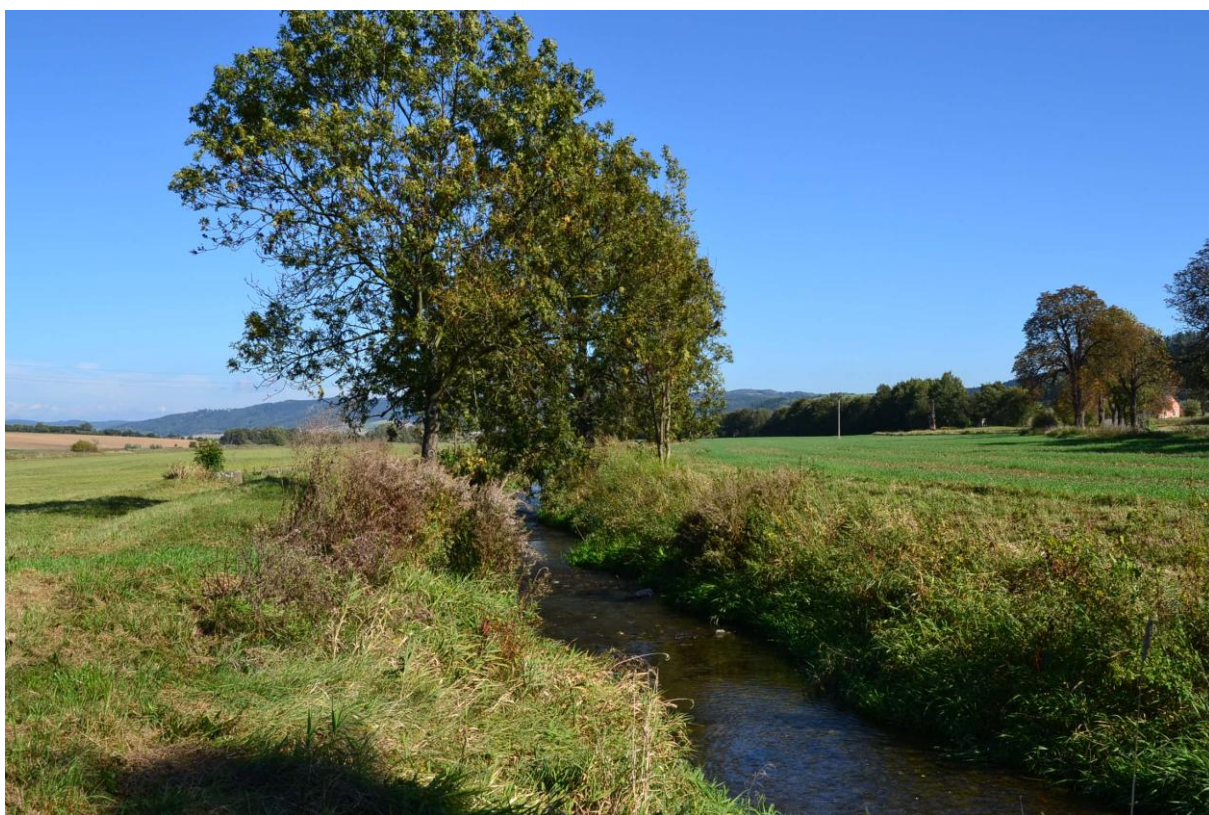
Obr. 21 Břehový porost kolem koryta řeky Jevíčky