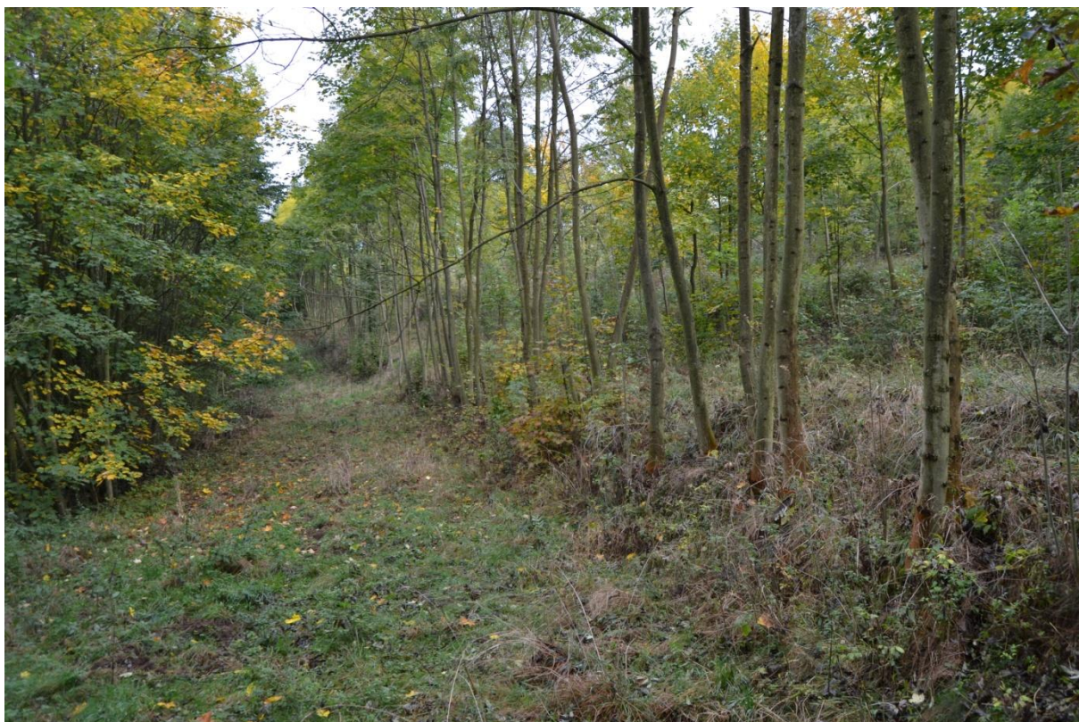
Obr. 24 Lemy teras u Zálesí