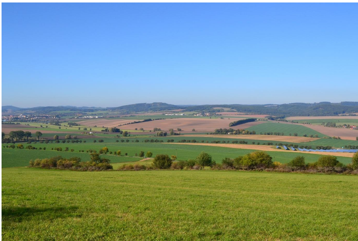
Obr. 1 Pohled na Jevíčskou sníženinu z Horky (444 m n. m.), lze pozorovat dobře viditelnou liniovou zeleň