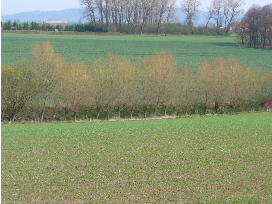
Obr. 22 Břehový porost vrb kolem Žlíbeckého potoka