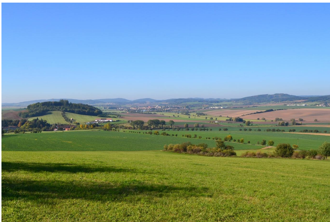
Obr. 2 Pohled na severní část Malé Hané a na vrchol Hejk vlevo (434 m n. m.), lze pozorovat dobře viditelnou liniovou zeleň (, 6. 10. 2012)