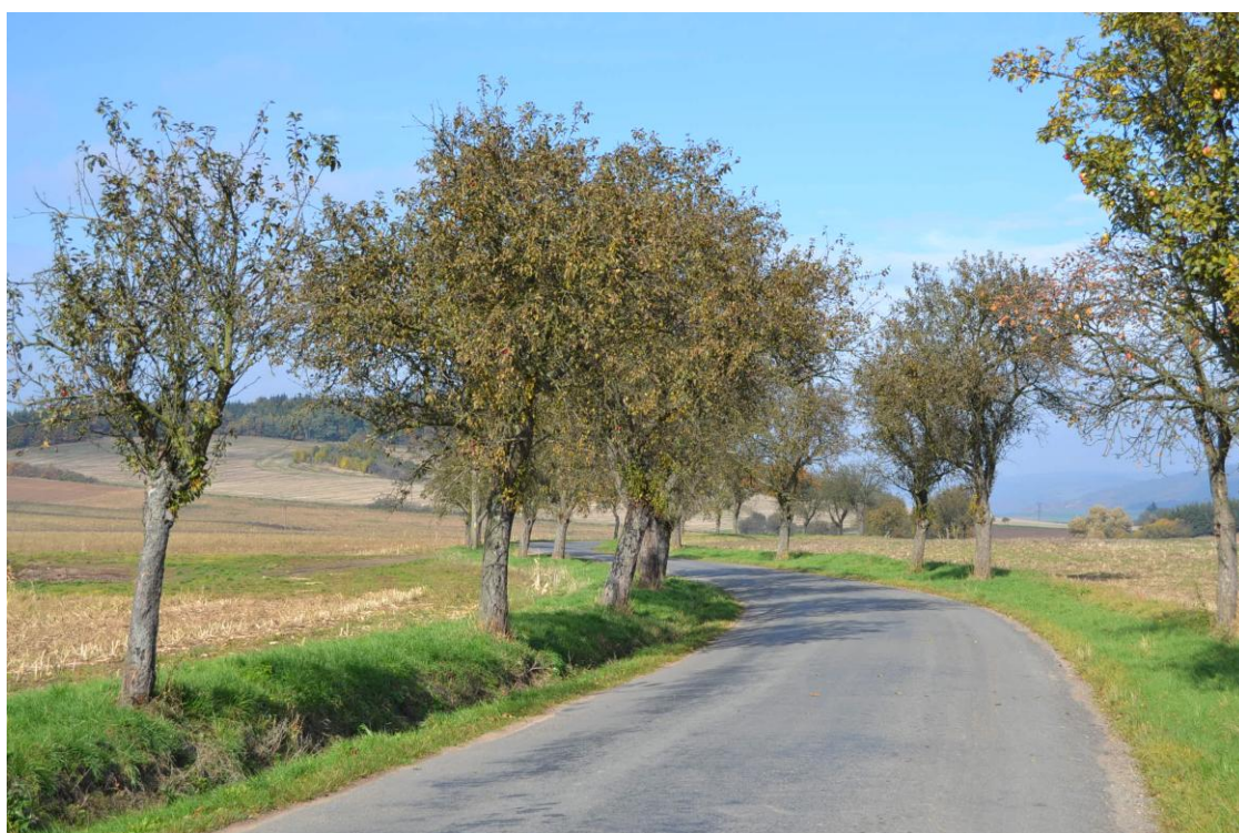
Obr. 8 Jabloňová alej, směrem k Biskupicím od obce Jaroměřice