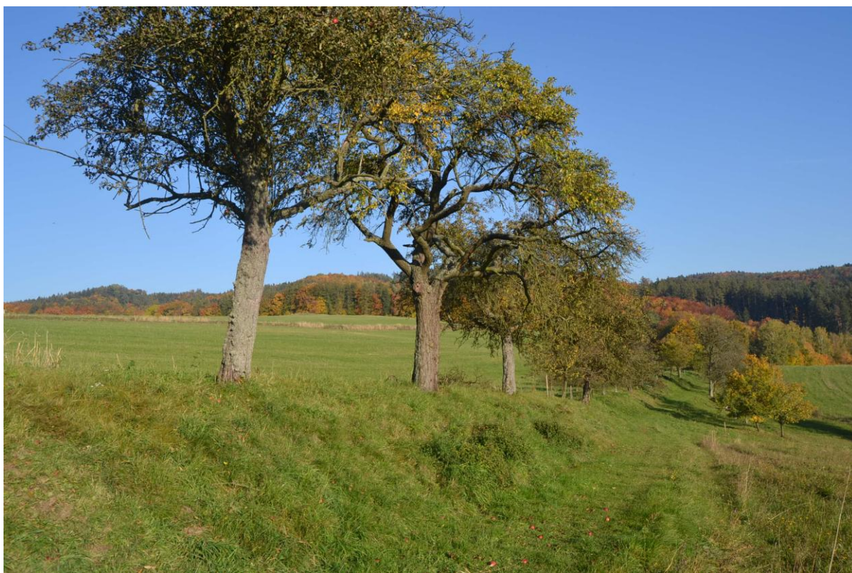
Obr. 27 Lemy teras u Březinek