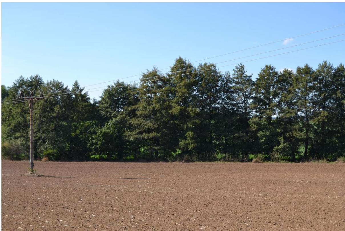
Obr. 18 Břehový porost Nectavského potoku, tvořen převážně olší lepkavou