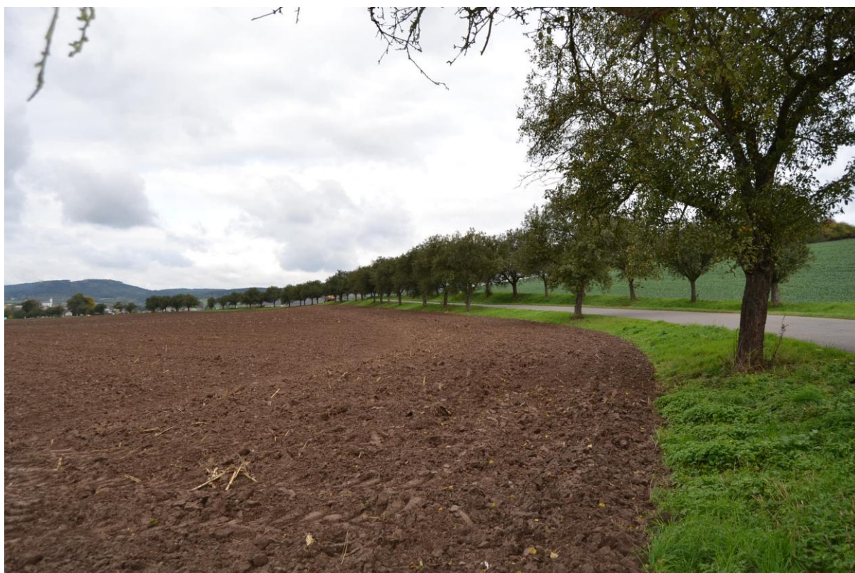
Obr. 11 Jabloňová alej, směrem k Jevíčku od obce Jaroměřice (, 15. 10. 2012)