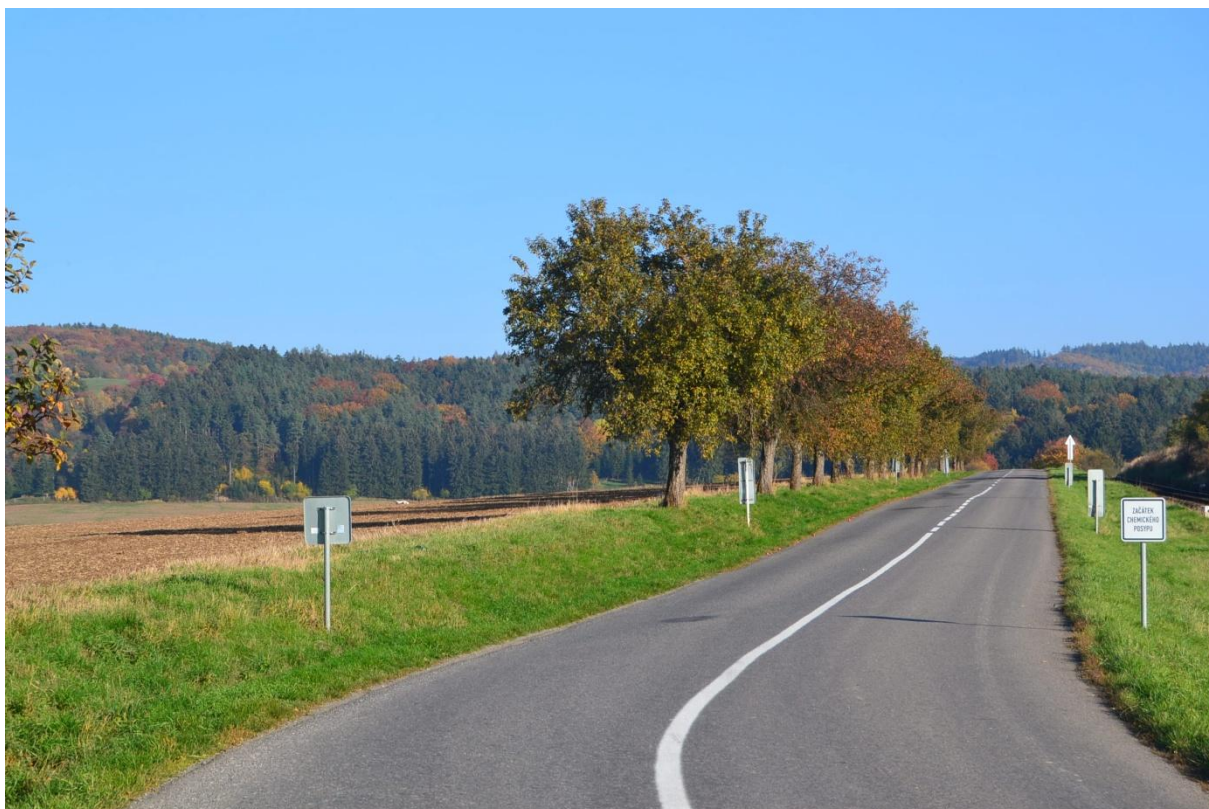
Obr. 36 Jabloňové stromořadí podél silnice z Chornic do Vrážného