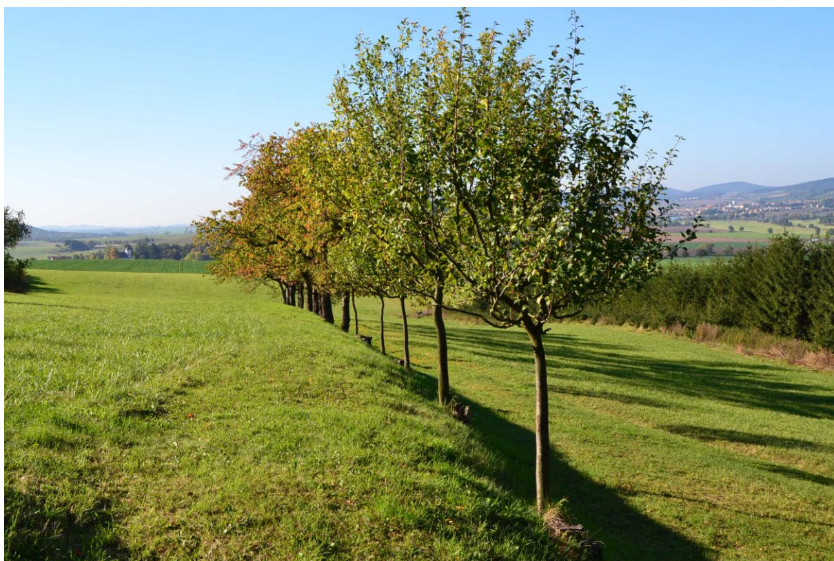
Obr. 30 Dobře udržované lemy teras pod Horkou, tvořeny hlavně slivoněmi a třešněmi