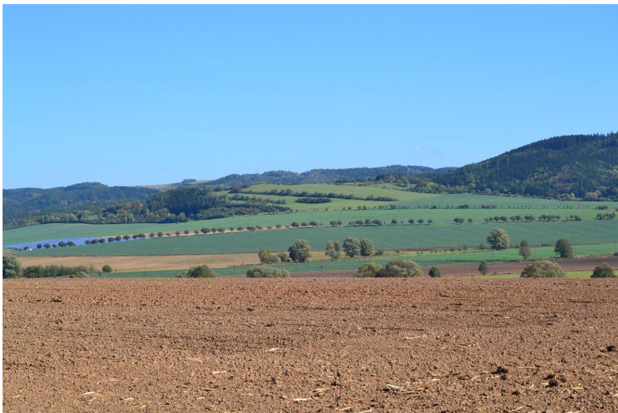
Obr. 3 Pohled na stromořadí a terasy pod Horkou (444 m n. m.)