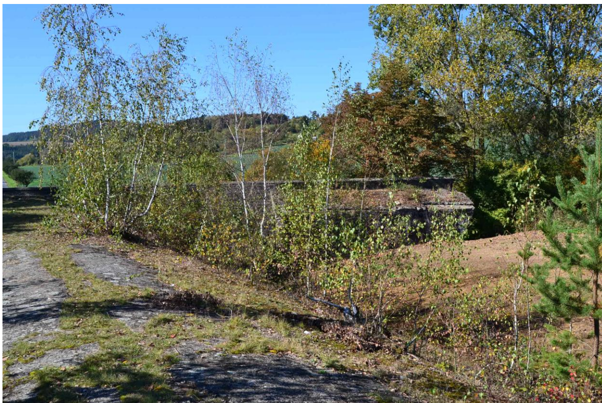
Obr. 40 Pionýrské dřeviny (bříza), zarůstající starou mostní konstrukci „Hitlerovy dálnice“