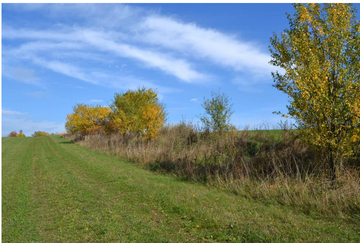
Obr. 37 Pás vegetace na Horce