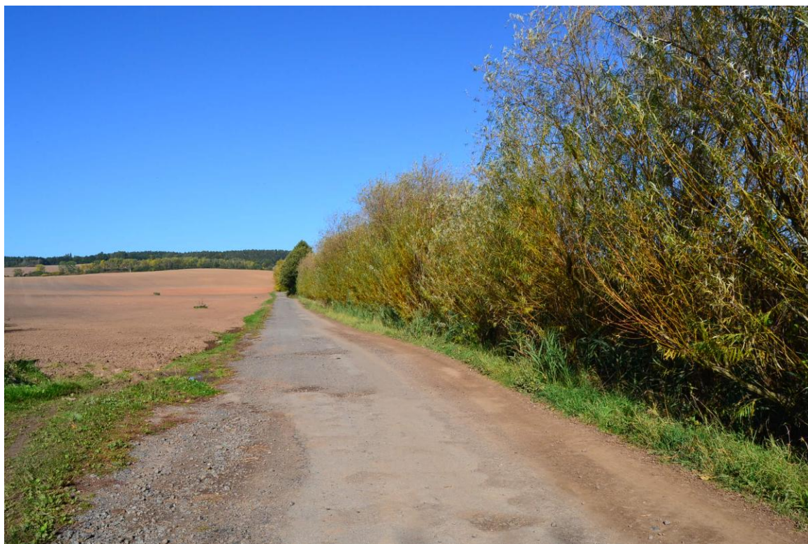
Obr. 19 Porosty vrb kolem bezejmenného toku ústící do Finsterlovy hlubiny