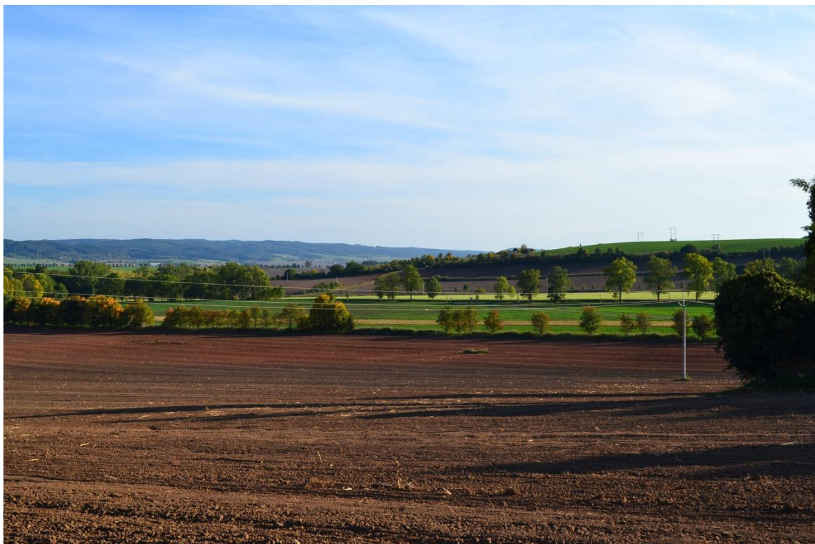
Obr. 6 Pohled na liniiovou zeleň od kostelíka sv. Bartoloměje