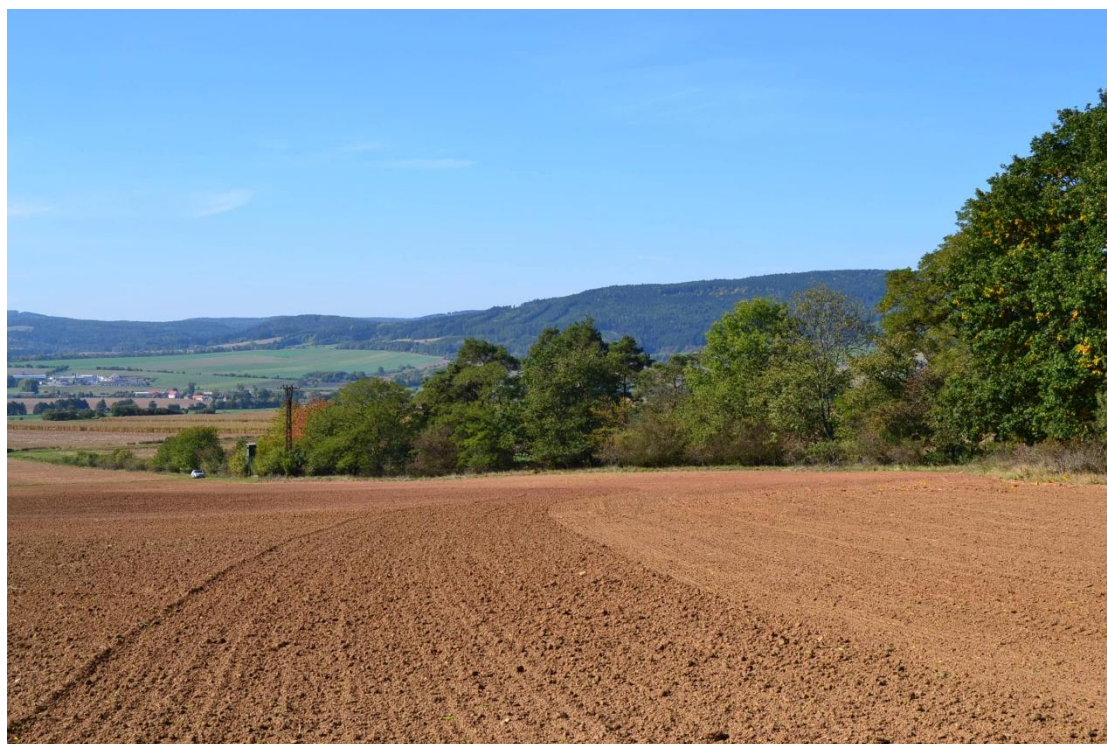
Obr. 41 Pás vegetace u Vrážného