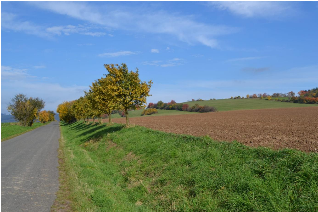
Obr. 16 Švestková alej vedoucí z Biskupic do Nectavy