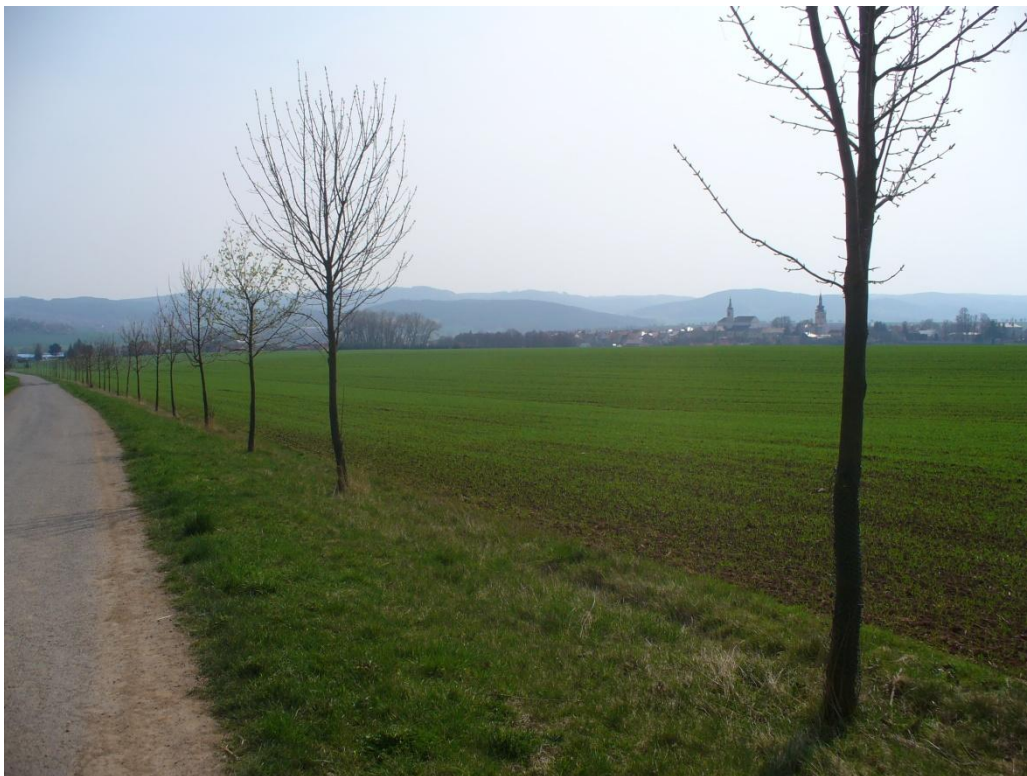
Obr. 34 Juvenilní stromořadí javorů lemující komunikaci za zemědělským družstvem v Jevíčku