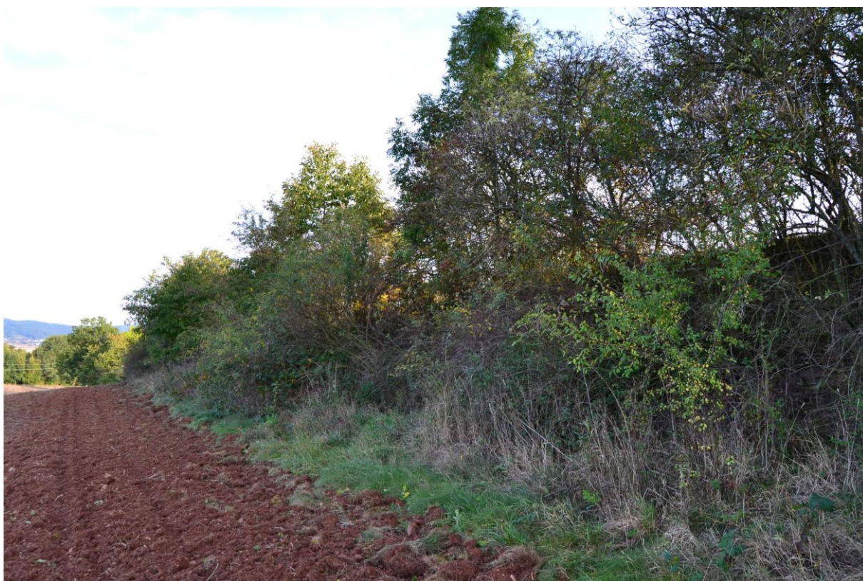
Obr. 26 Lemy teras pod Červeným kopcem