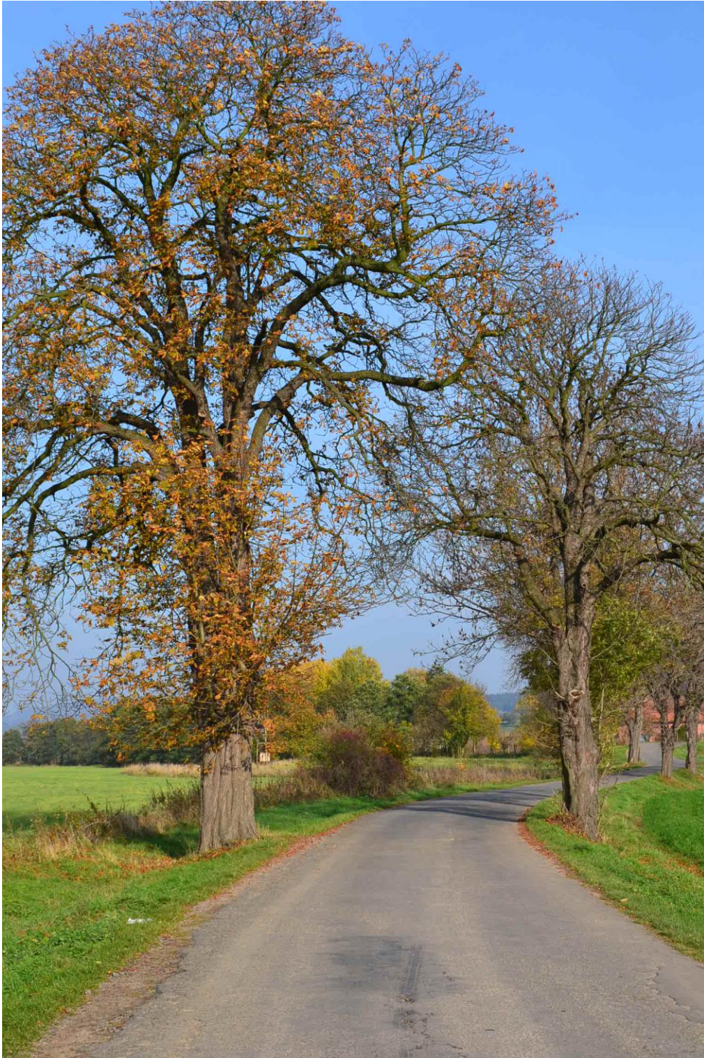
Obr. 9 Jírovcová alej, směrem od Jevíčka k Biskupicím (, 20. 10. 2012)