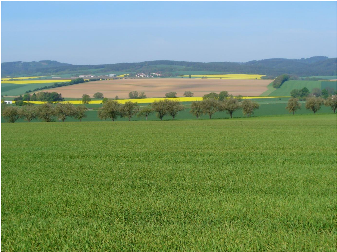
Obr. 5 Liniová zeleň členící intenzivně využívanou zemědělskou krajinu