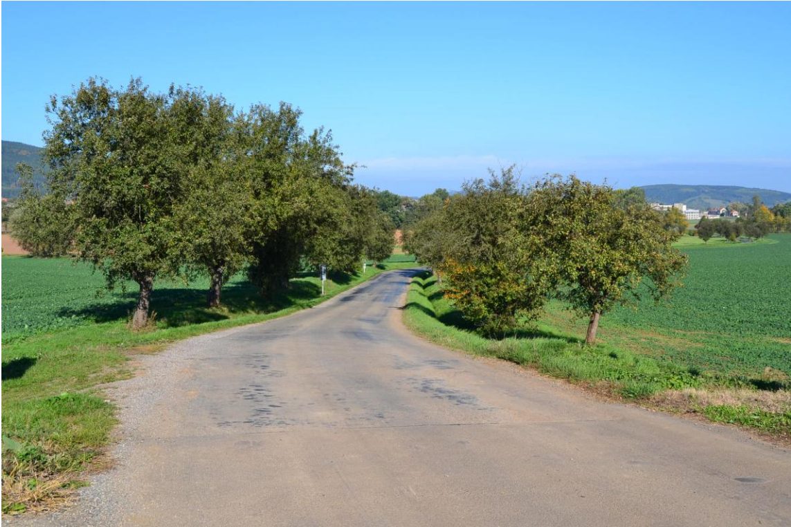
Obr. 15 Jabloňová alej vedoucí od Biskupic k Chornicím