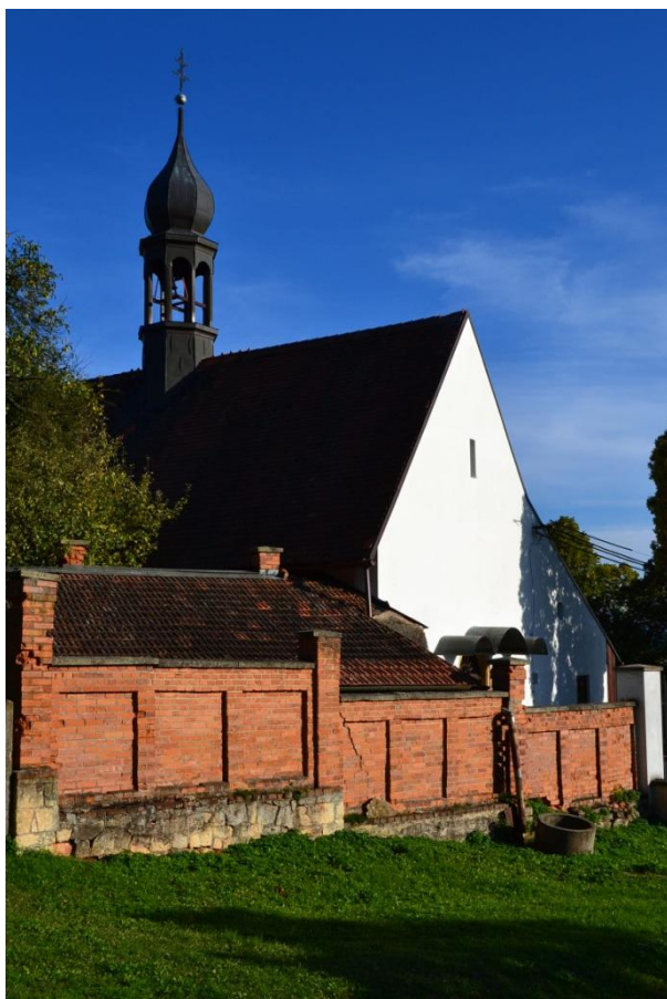
Obr. 28 Kostelík sv. Bartoloměje, u kterého jsou dobře zachovány lemy teras (, 8. 10. 2012)