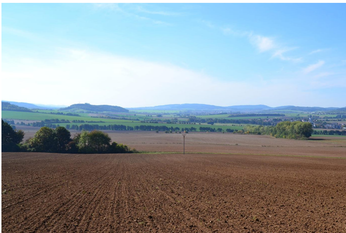
Obr. 4 Pohled od Vrážného směrem na Jevíčko, patrné jsou zde liniové prvky zeleně: pás, větrolam, břehový porost, stromořadí