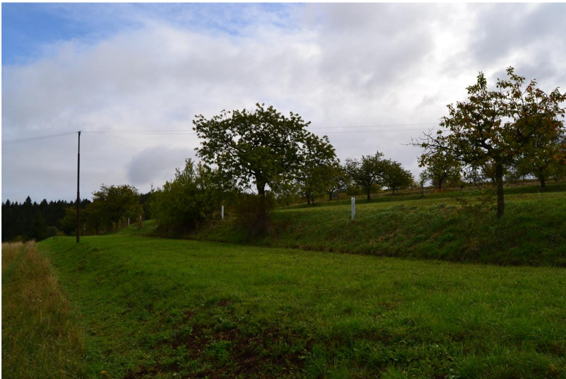
Obr. 23 Lemy teras u Flintouru