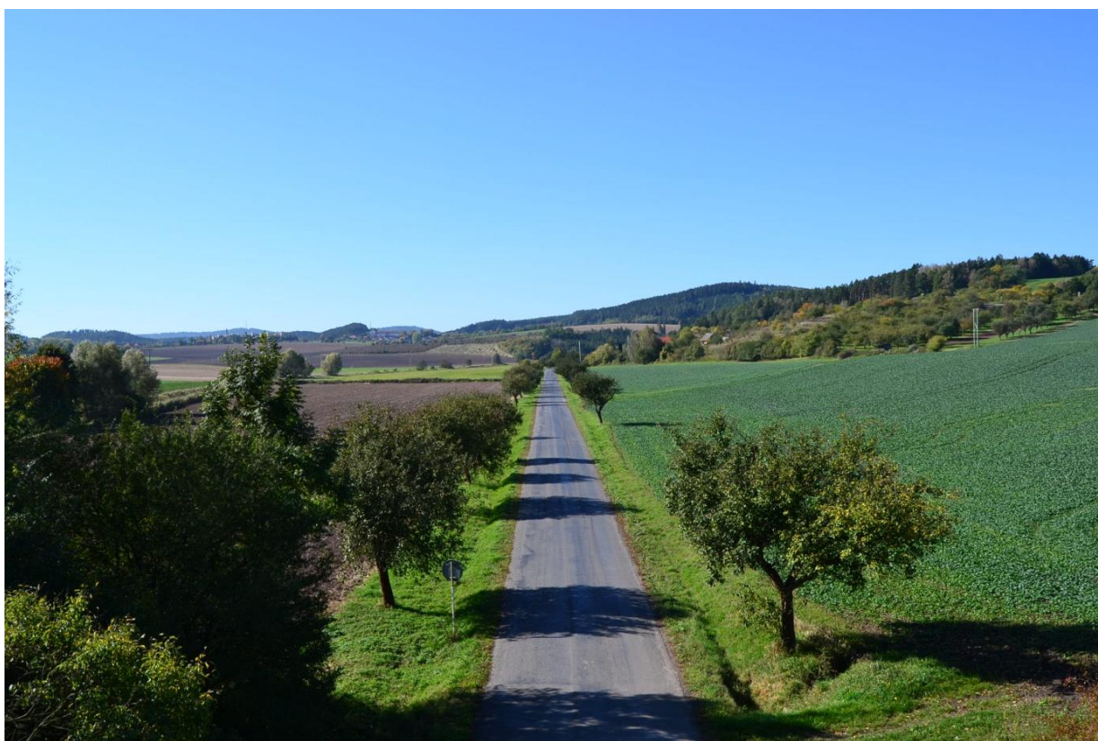
Obr. 14 Jabloňová alej vedoucí od Jevíčka ke Smolenské přehradě, pohled z mostní konstrukce Hitlerovy dálnice