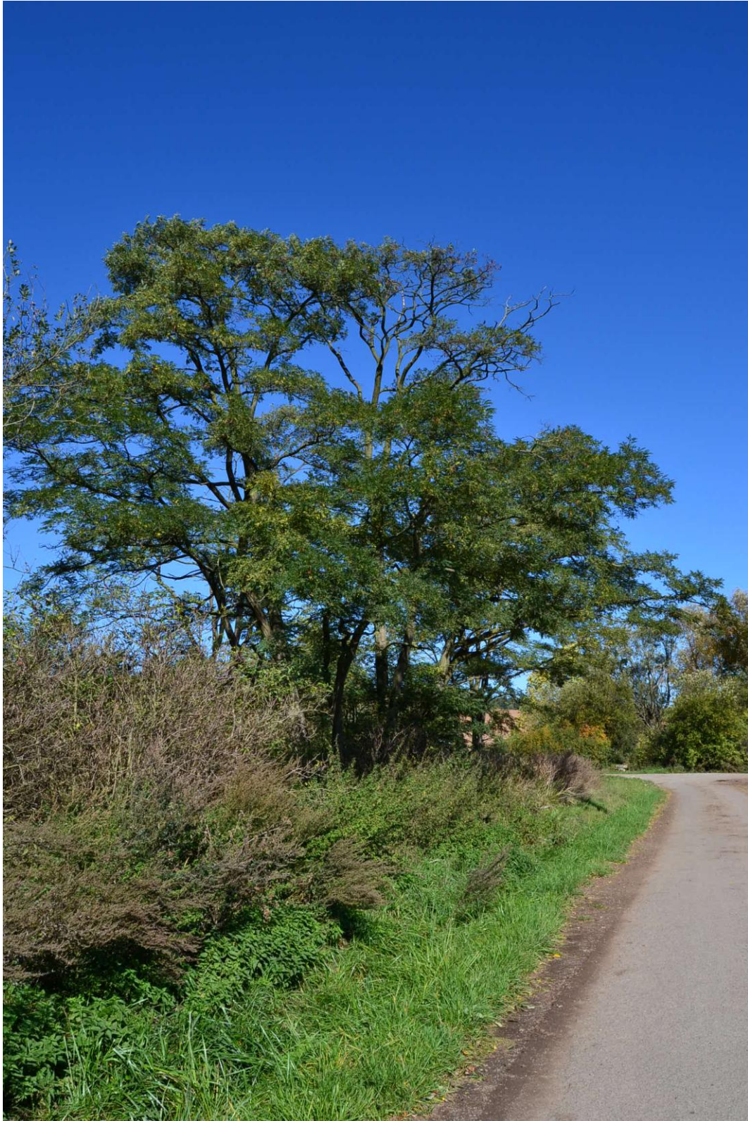
Obr. 39 Trnovník akát – invazivní druh, rostoucí v pruhu „Hitlerovy dálnice“ (, 6. 10. 2012)